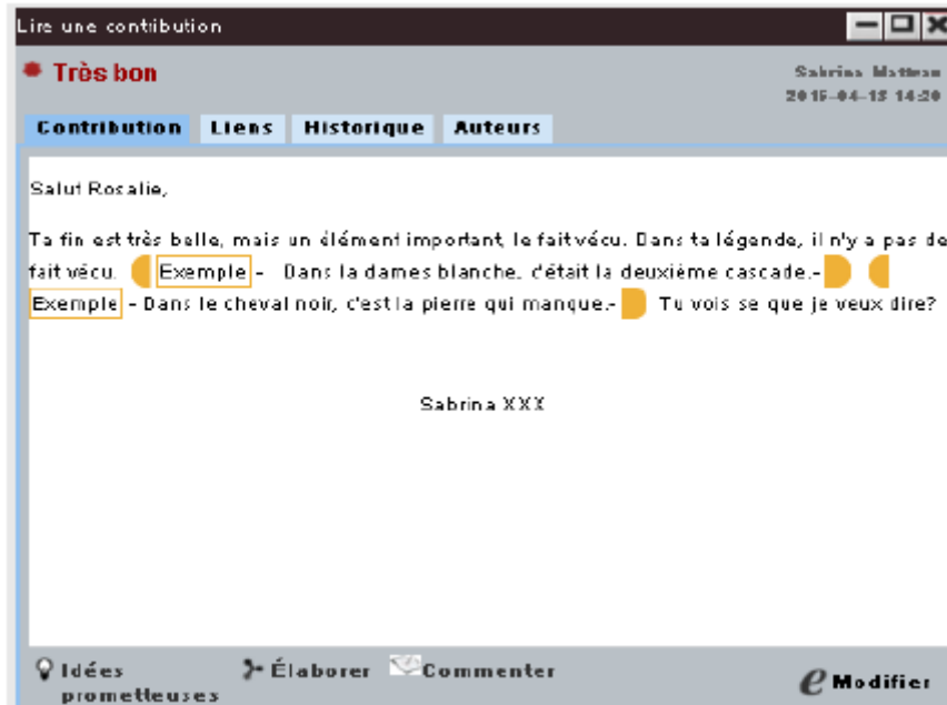
Figure 4. Commentaire contenant un exemple de proposition de précision à l'histoire