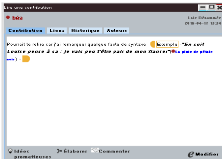
Figure 5. Commentaire contenant un exemple de reprise d'erreur liée à la qualité de la langue